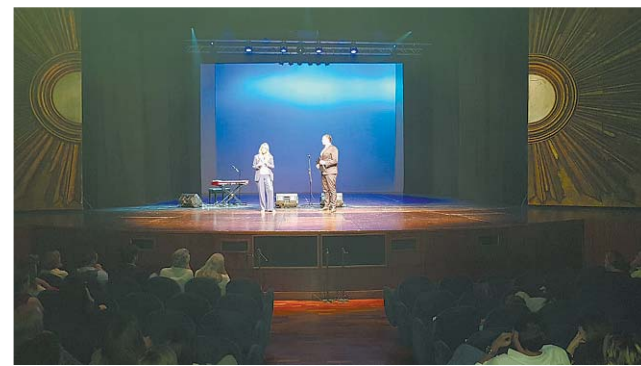
Un sorriso per i bambini malati Lo spettacolo al Teatro Lyrick di Assisi